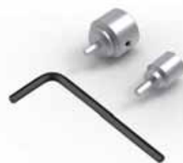
调节手轮及内六角扳手